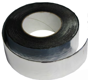
Bande d'étanchéité de 10 m longueur 5 cm