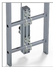
Détail fixation sur échelon