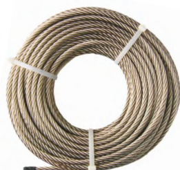
Câble Inox diamètre 8 mm