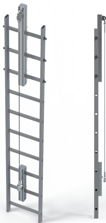
Installation type en sortie latérale