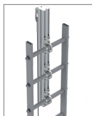
Kit de fixations à l'échelle (réf: FLEEXFVFE) avec kit de renfort d'échelle (réf: FLEEXFVRE)