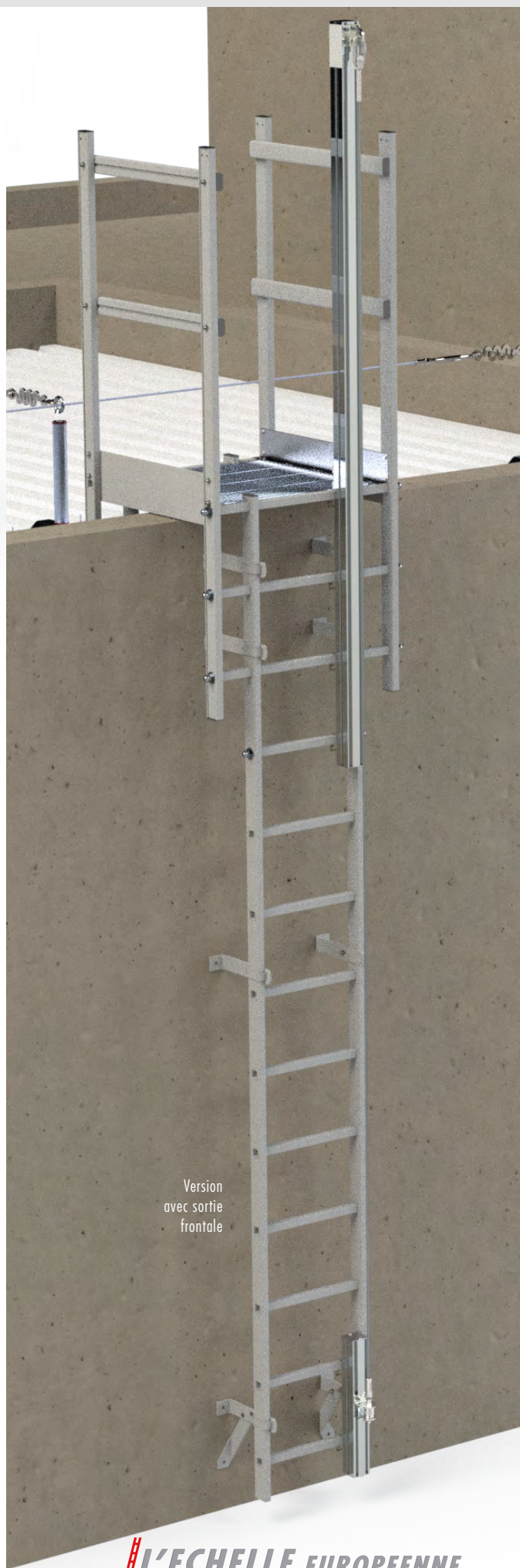
Version avec sortie frontale