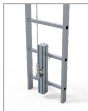
Support inférieur (réf: FLEEXFVSI) avec régulateur de tension