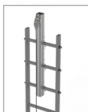
Barre de sortie latérale (réf: FLEEXFVSL)