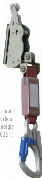
Coulisseau muni d'un absorbeur d'énergie (réf: EESVAC351)