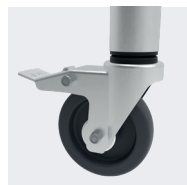
Roues Ø125mm anti-traces