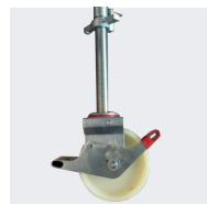
Roues Ø200mm à blocages réglables sur le modèle 5,80m